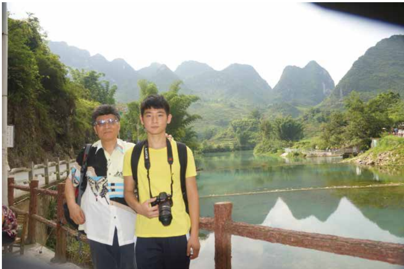
祖孙俩摄于百魔洞的天坑（百魔洞洞中有洞，洞中有河，洞内通天称为天坑）

干燥、灼热等敏感状况。百魔洞水同时受 0.45 至 0.5 高斯的强地磁影响，其水分子被切割成仅为 0.5 纳米的小分子结构，一接触皮肤就迅速渗入皮肤表层，直达有棘层和基底层。通过检验，泉水不含有机物、重金属、放射元素、微生物等，故接近零污染。水中 PH 值 7.38-7.53，属于微碱性，接近人体血液 PH 值。且富含丰富矿物质和微量元素，氧化还原电位低，故据说具有养肤生肌、祛除胃炎，化解肾胆结石之功效，这种水还能参加和改善生化作用，增强酶的活性，有利于降血脂、降血压，降低血黏度，促进微循环，使心脑血管粥样硬化症减轻和消失。据说每天喝四升这样的小分子水，坚持三个月，血糖恢复正常。从清晨到到黄昏在百魔洞的泉口取水的人群络绎不绝，我自然也加入了取水的人群。土地是万物之源，而巴马有一条断裂带，直接切过地球地幔层。这条断裂带就在盘阳河地下，断裂带把巴马一分为二（即西山、凤凰、东山三个乡为石山地区，其余七个乡镇是土坡丘陵地区）。地球的一般地区地磁约在 0.25 高斯，而巴马的地磁高达 0.58 高斯，是一般地区的一倍多。有科学考证：人们生活在恰当的地磁场环境中，身体发育好，血