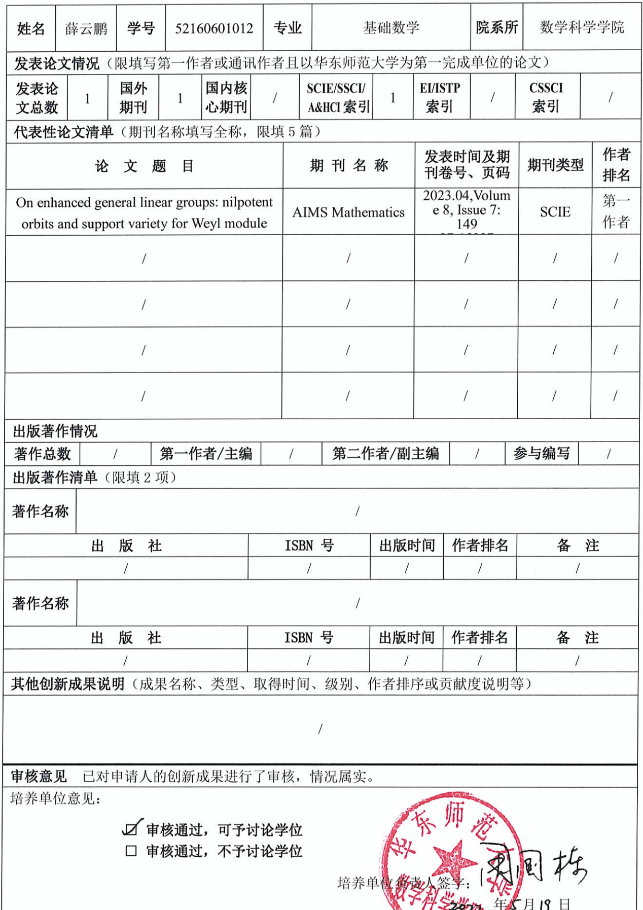
华东师范大学博士研究生在读期间创新成果信息表